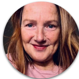
Will Ontijd Gebiedsregisseur Stadsbeheer